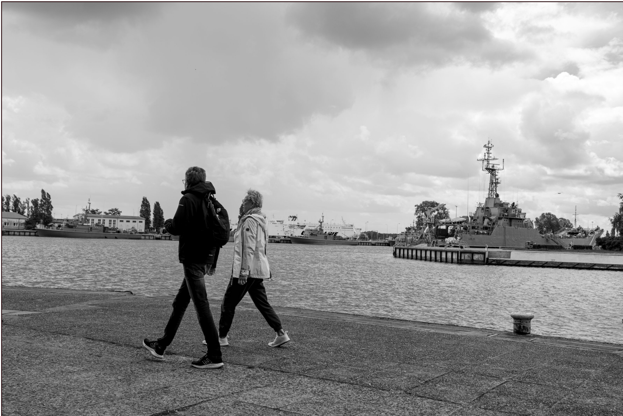
Hafen Świnoujście (Swinemünde)