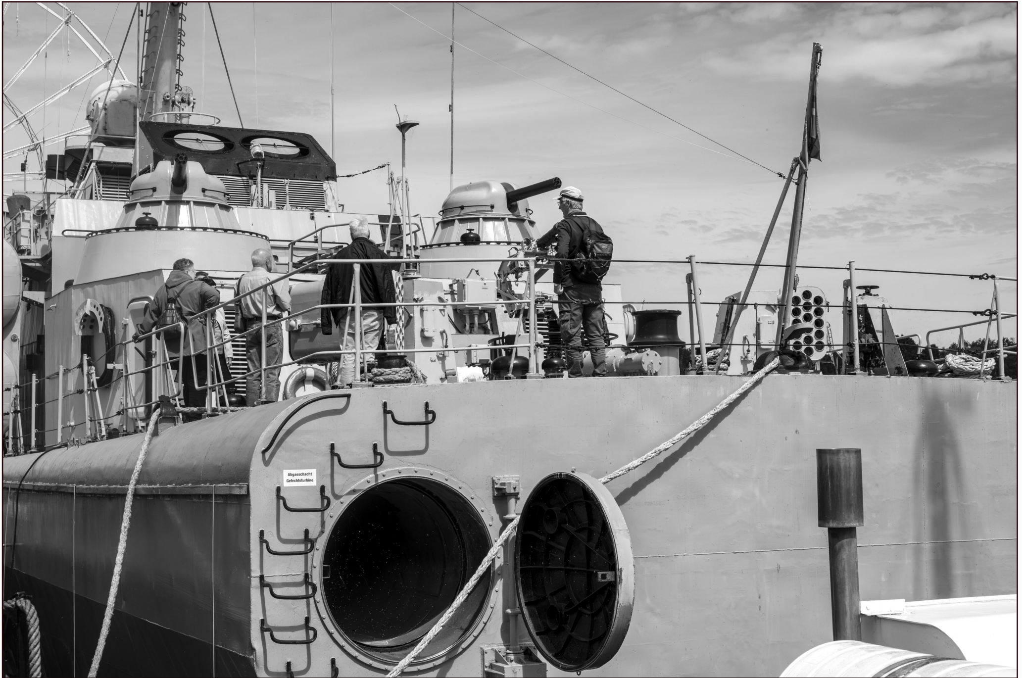
Museumsschiff (Raketenschnellboot der Volksmarine) | Peenemünde