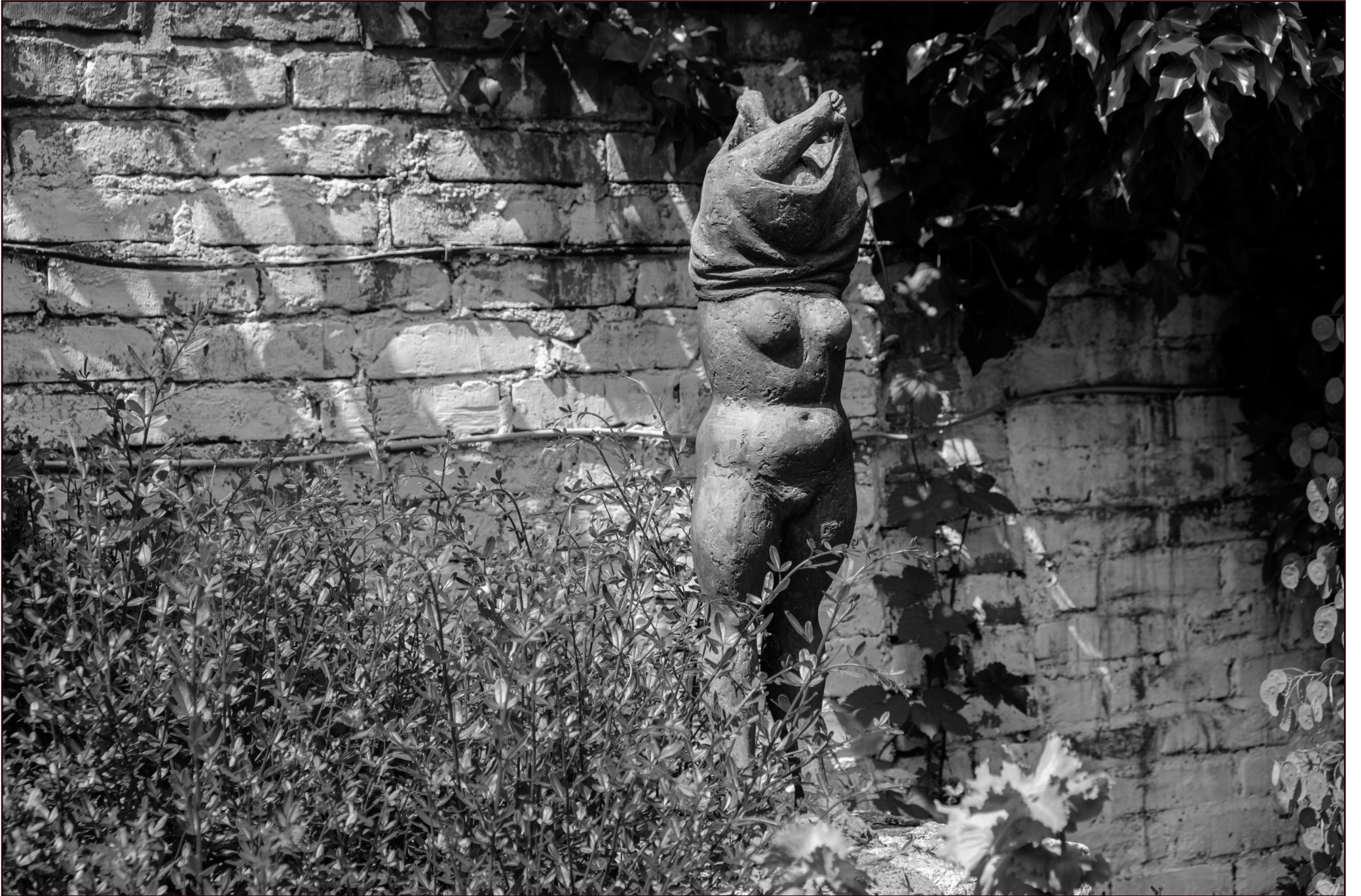
"Hemd ausziehen" v. Wieland Förster | Gedenkstätte Niemeyer-Holstein