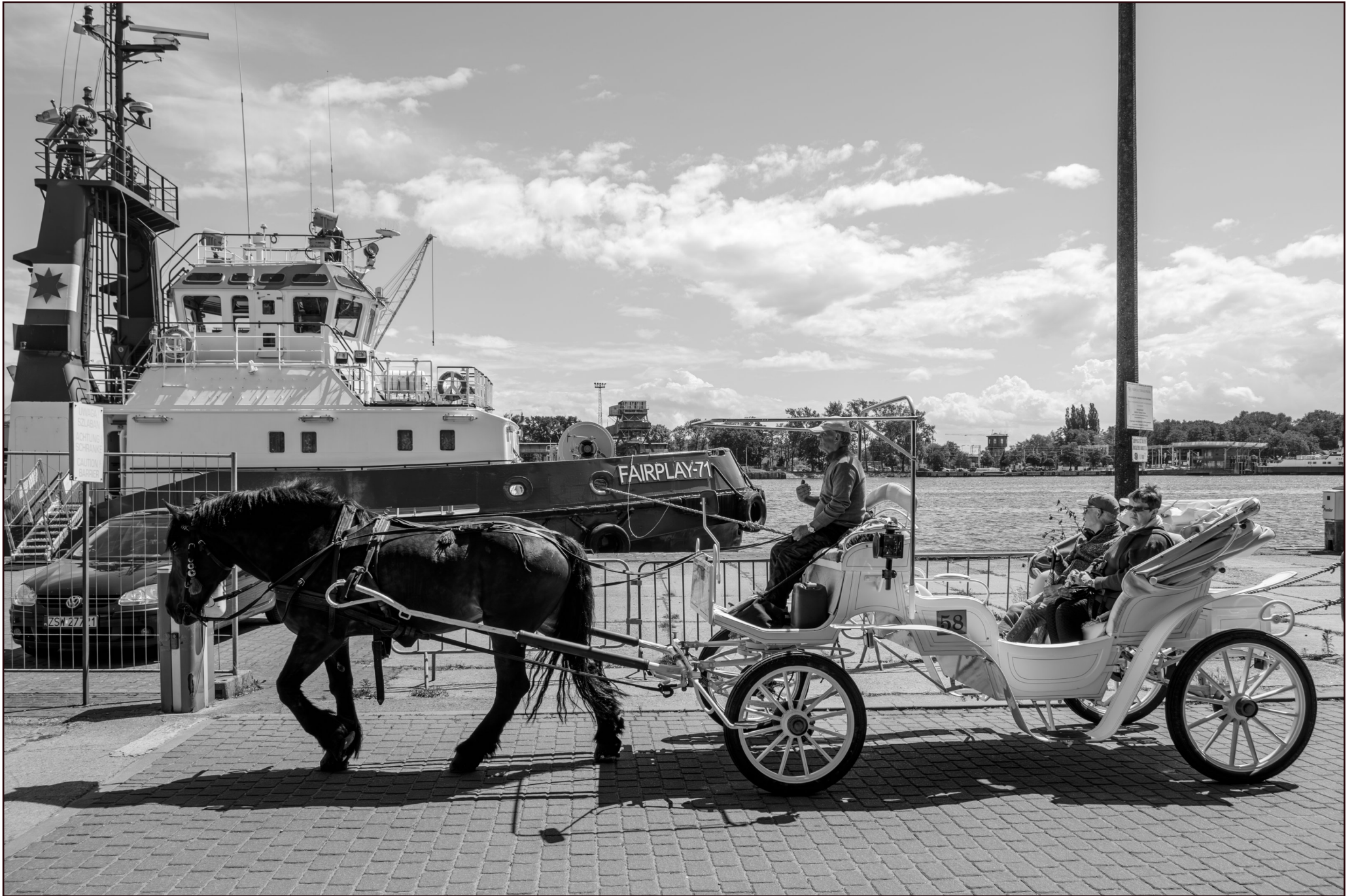
Hafen Świnoujście (Swinemünde)