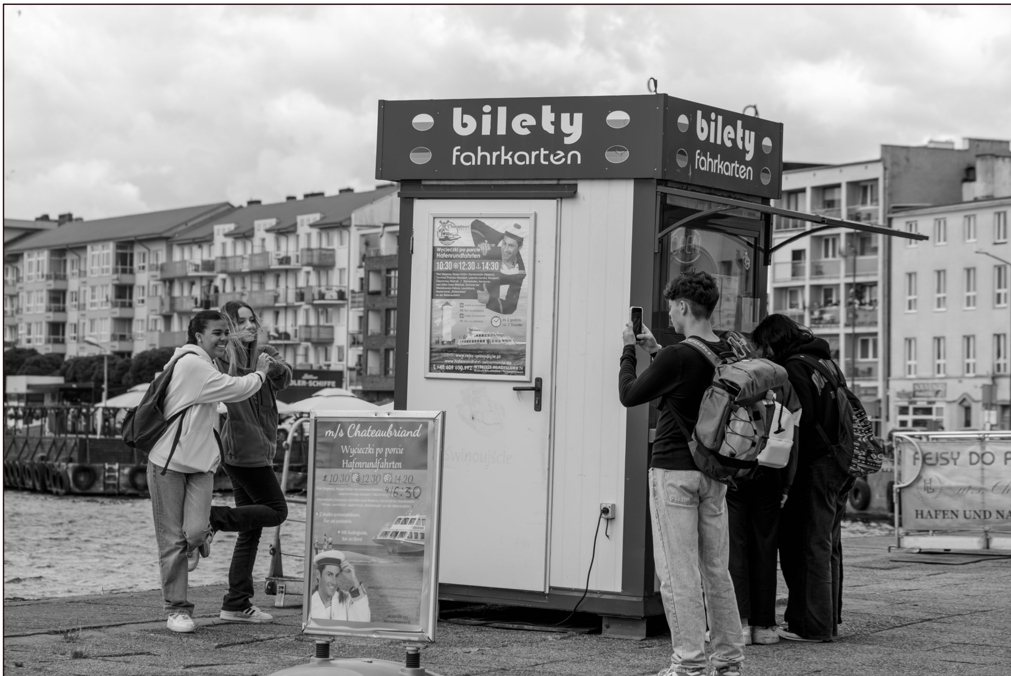
Hafen Świnoujście (Swinemünde)