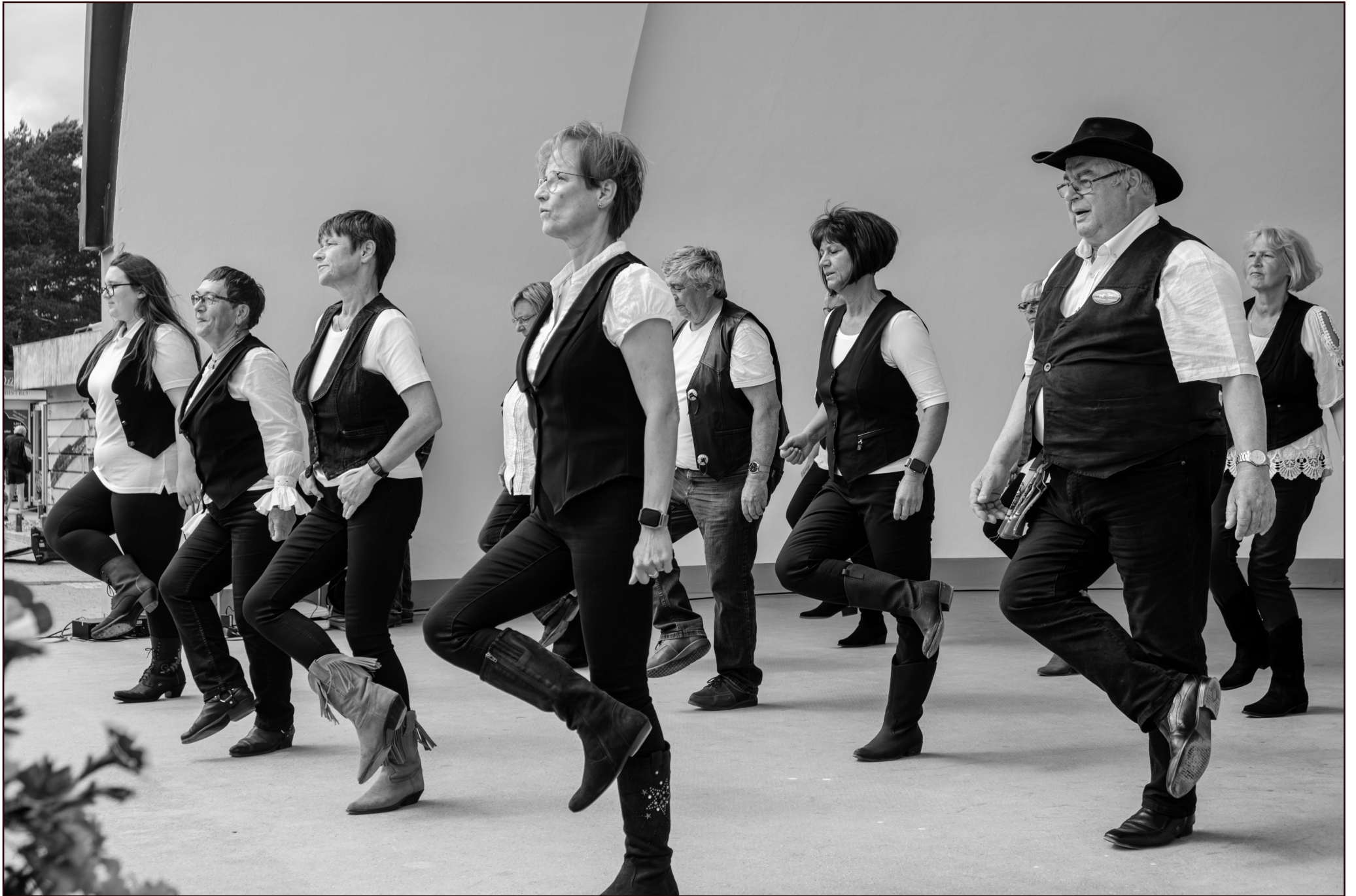
"Line Dance Company K lpinsee"