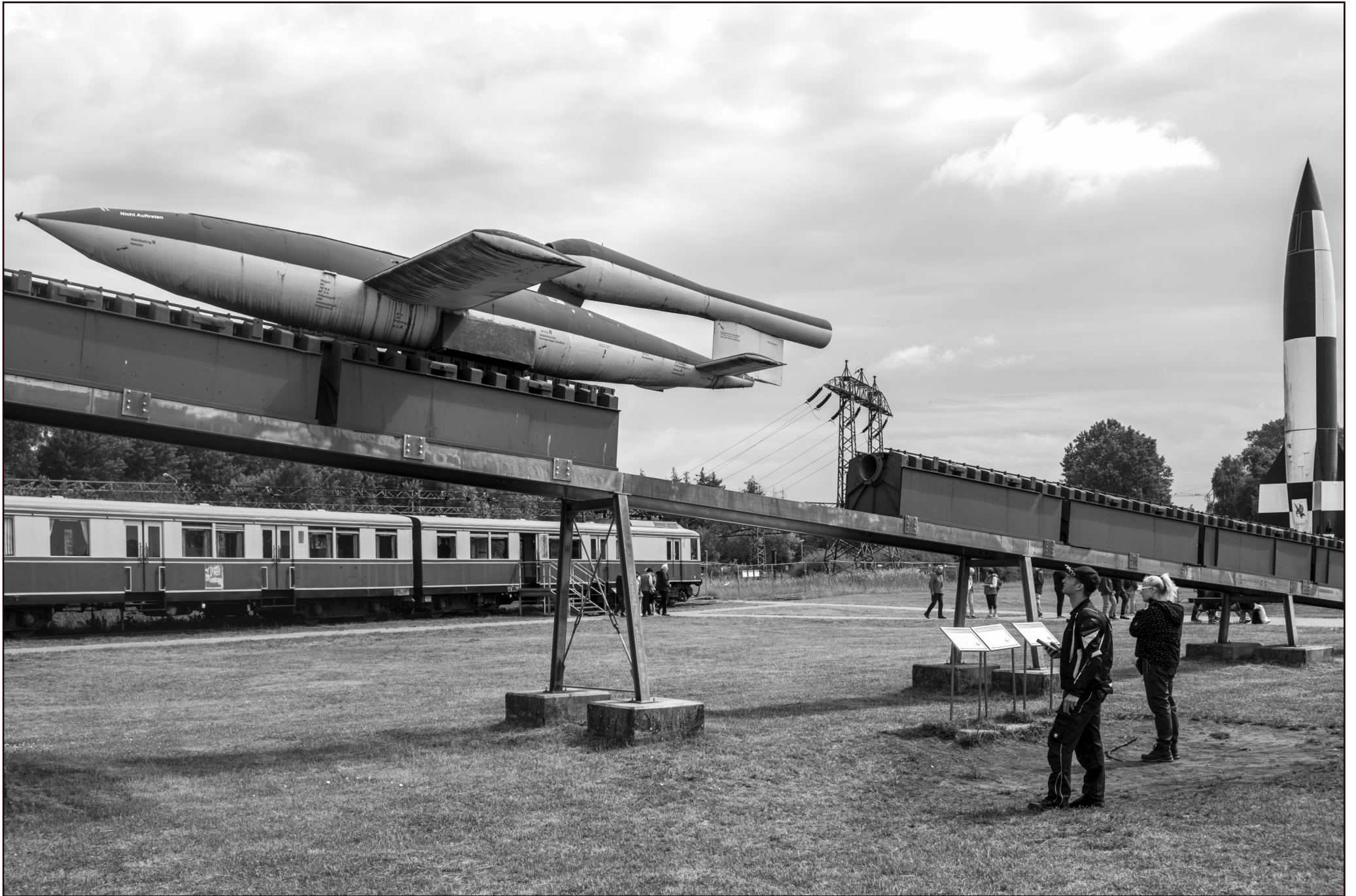
ehem. Heeresversuchsanstalt | Peenemünde