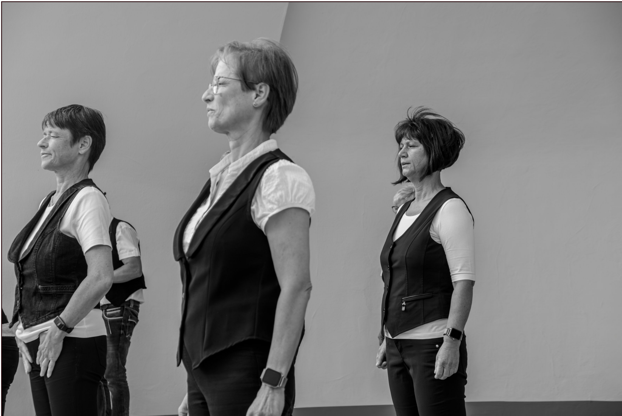
"Line Dance Company Kölpinsee"