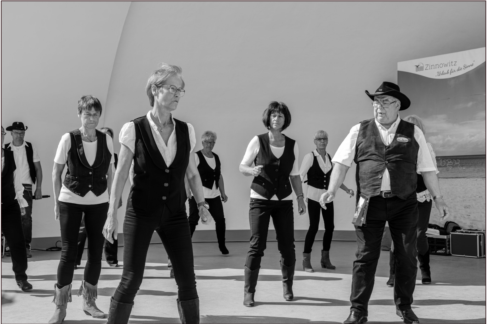
"Line Dance Company Kölpinsee"