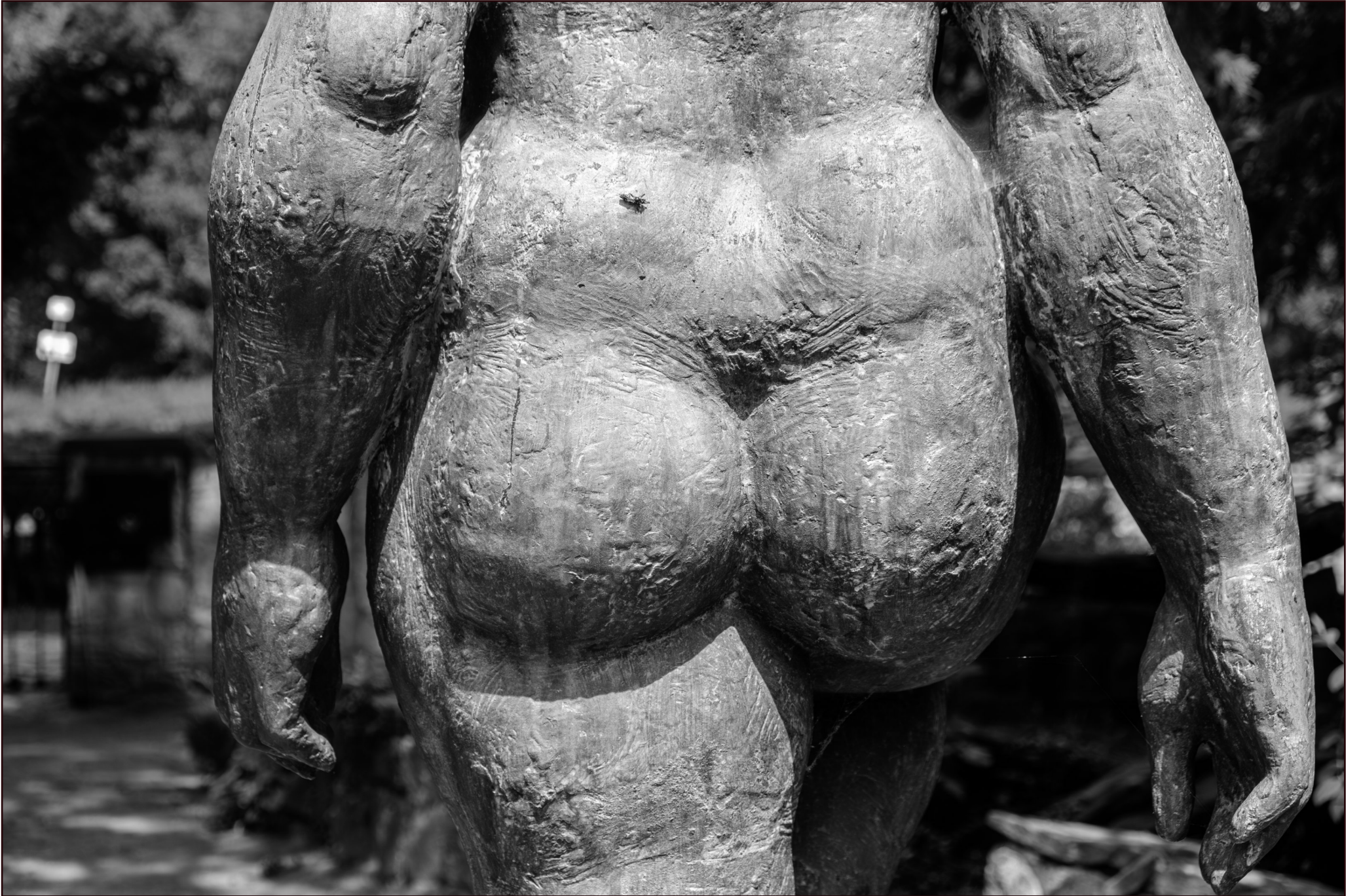
"Große Stehende" v. Wieland Förster | Gedenkstätte Niemeyer-Holstein