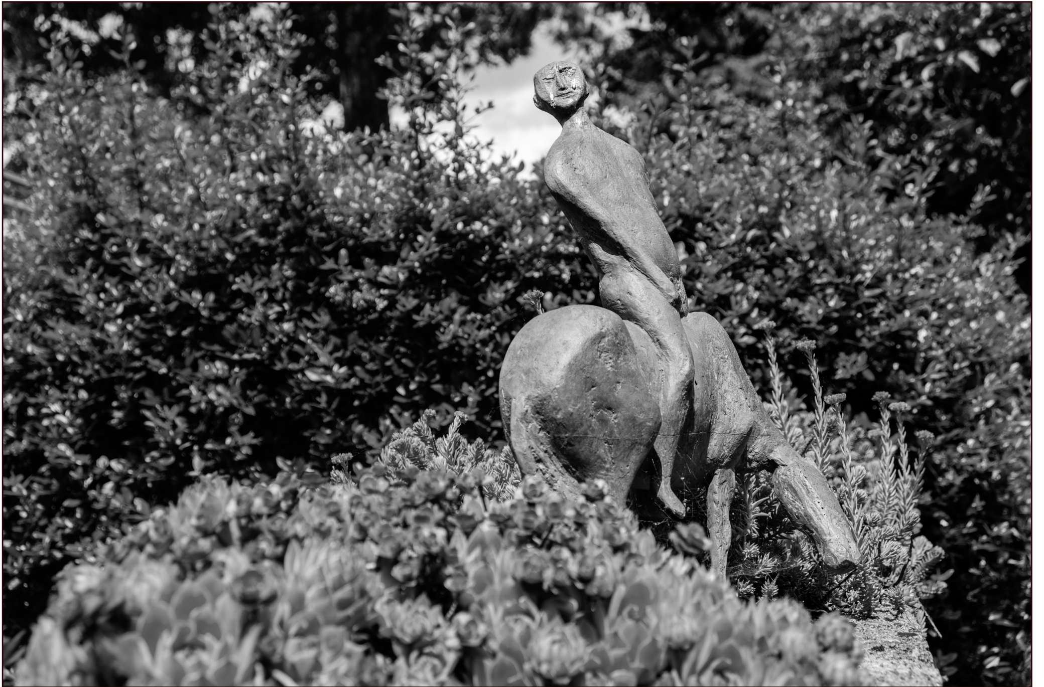
Plastik (k.A.) | Gedenkstätte Niemeyer-Holstein