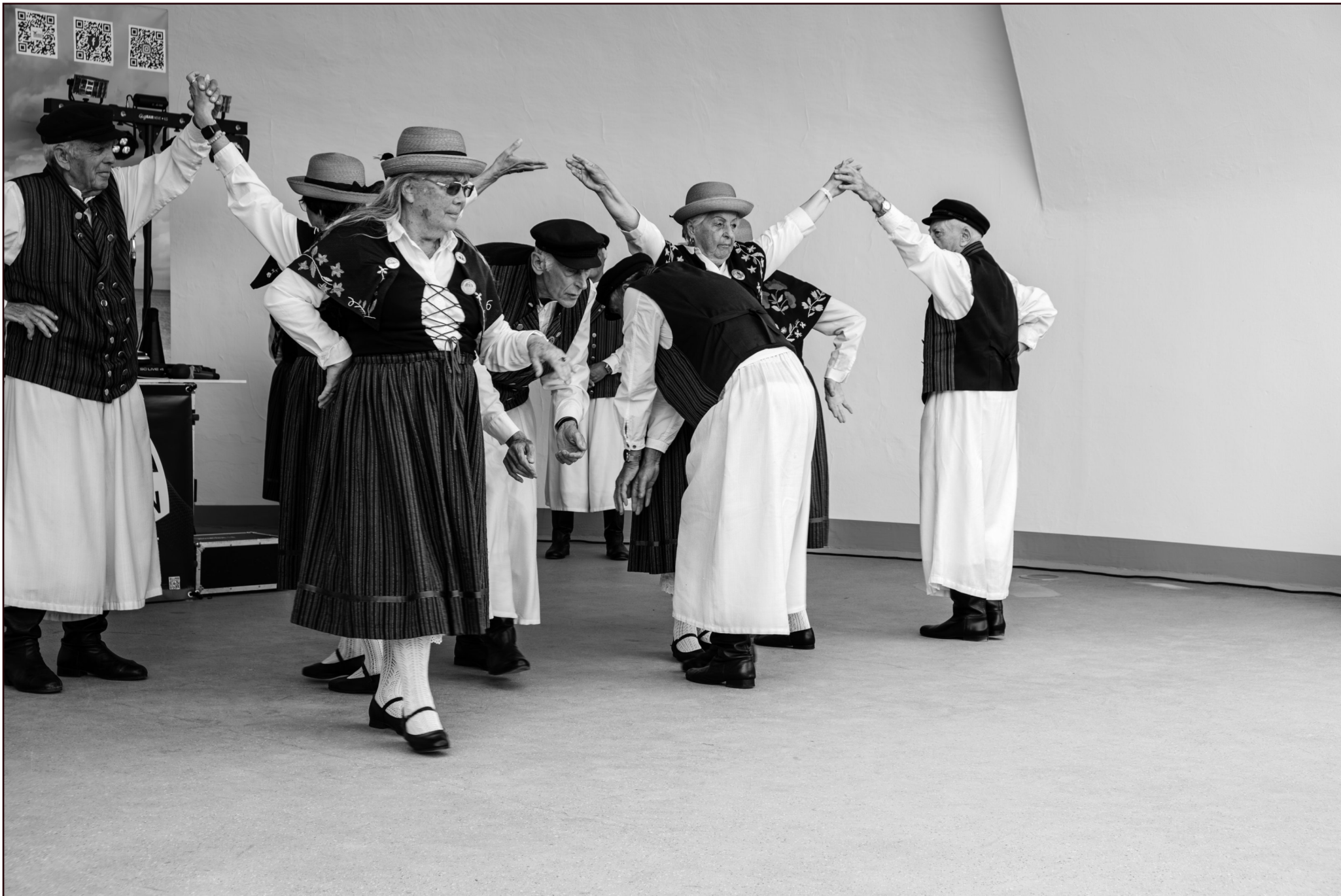
"Dei Lieper-Winkel'schen Danzlüh" | Volkstanzgruppe