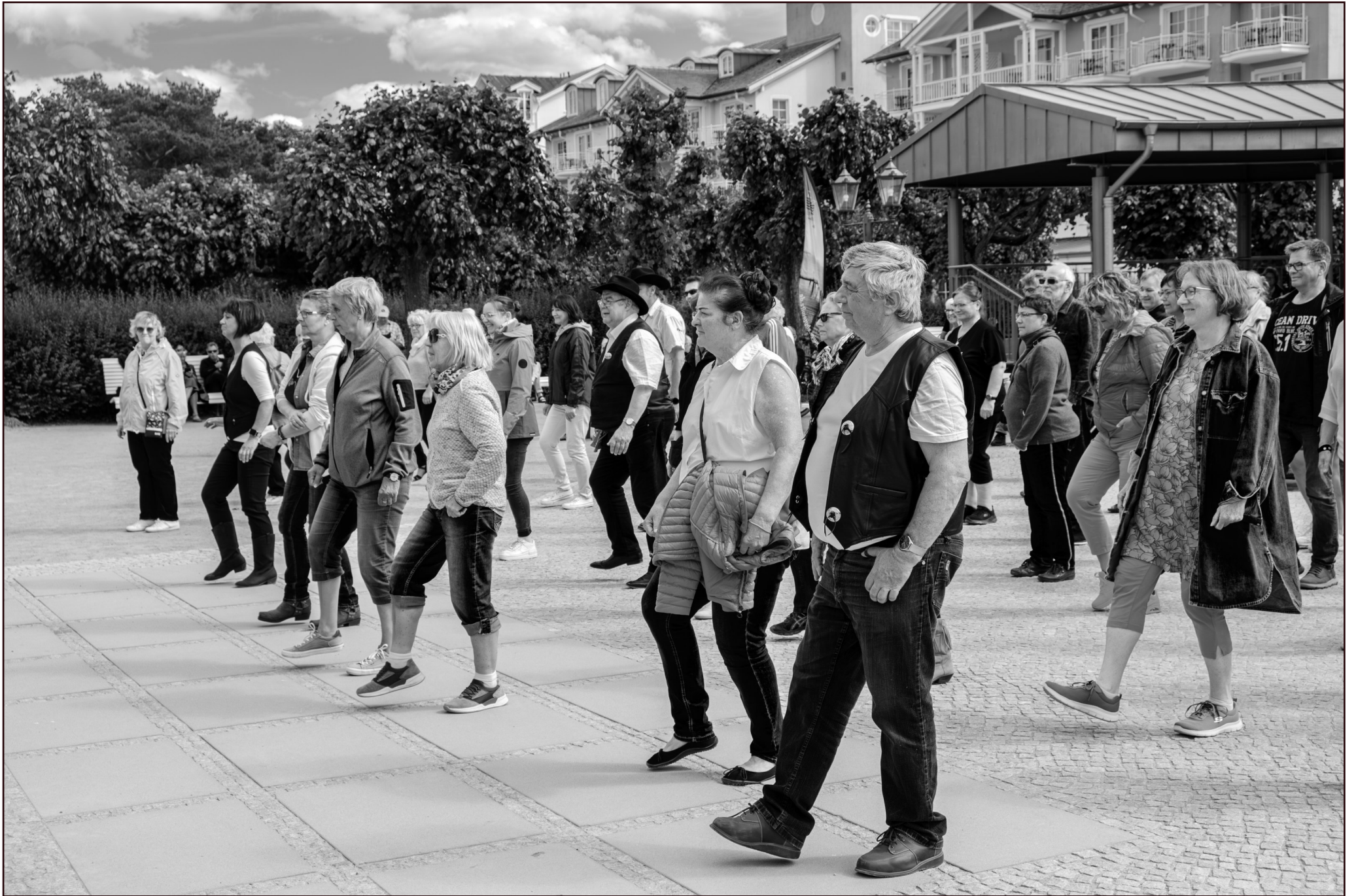
Tanzworkshop Line Dance