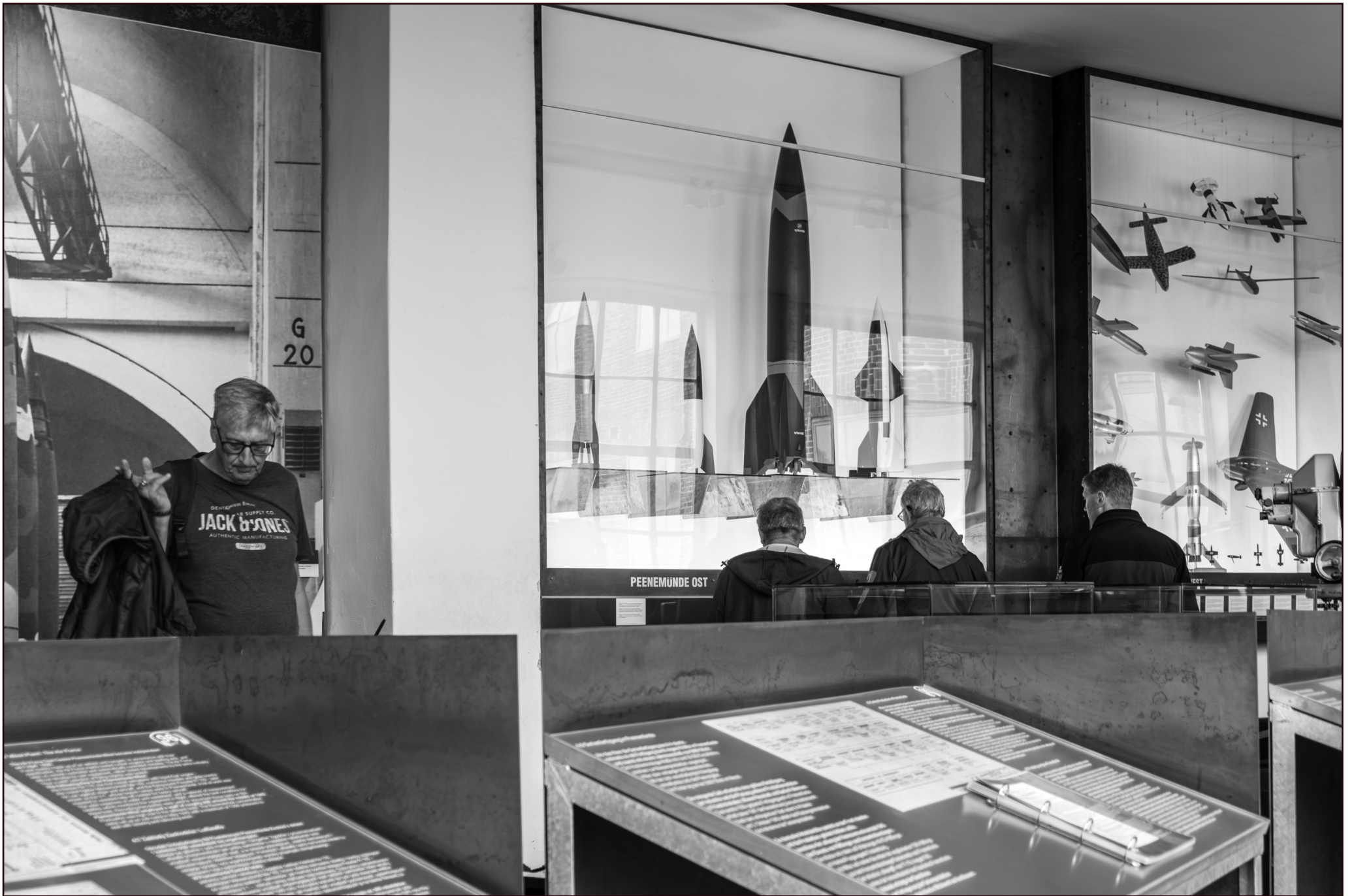
Museum ehem. Heeresversuchsanstalt | Peenemünde