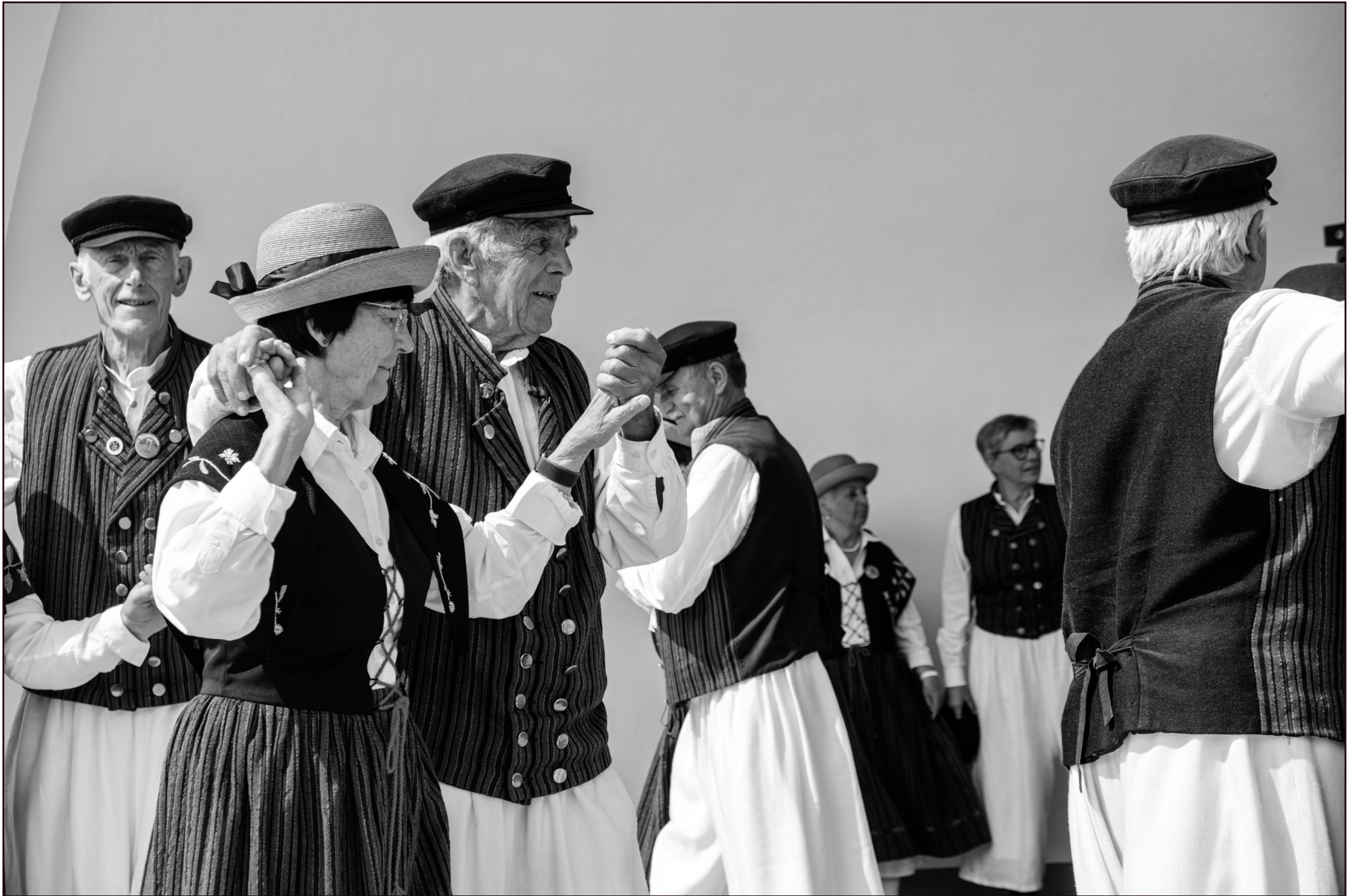
"Dei Lieper-Winkel'schen Danzlüh" | Volkstanzgruppe