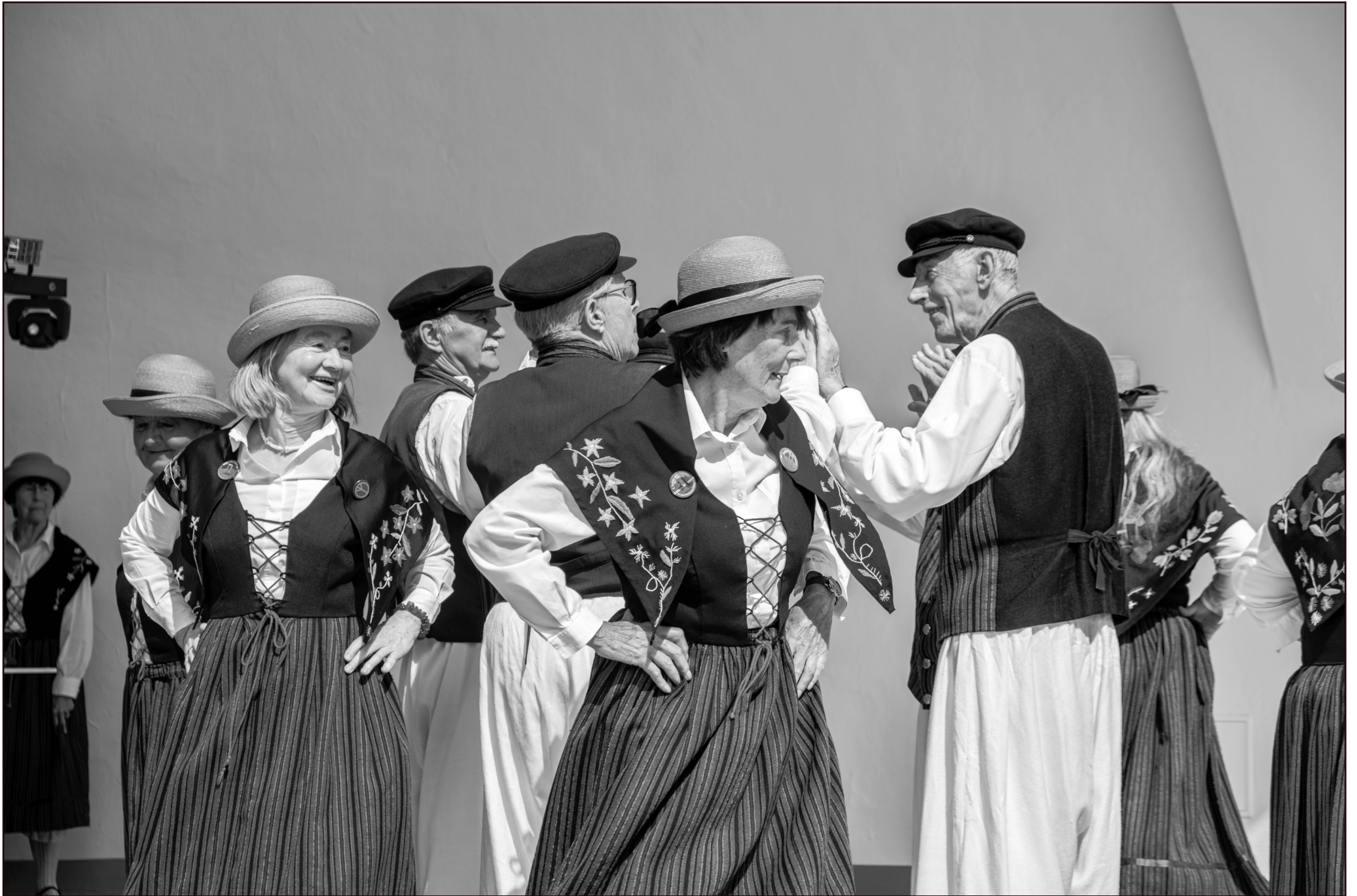
"Dei Lieper-Winkel'schen Danzlüh" | Volkstanzgruppe