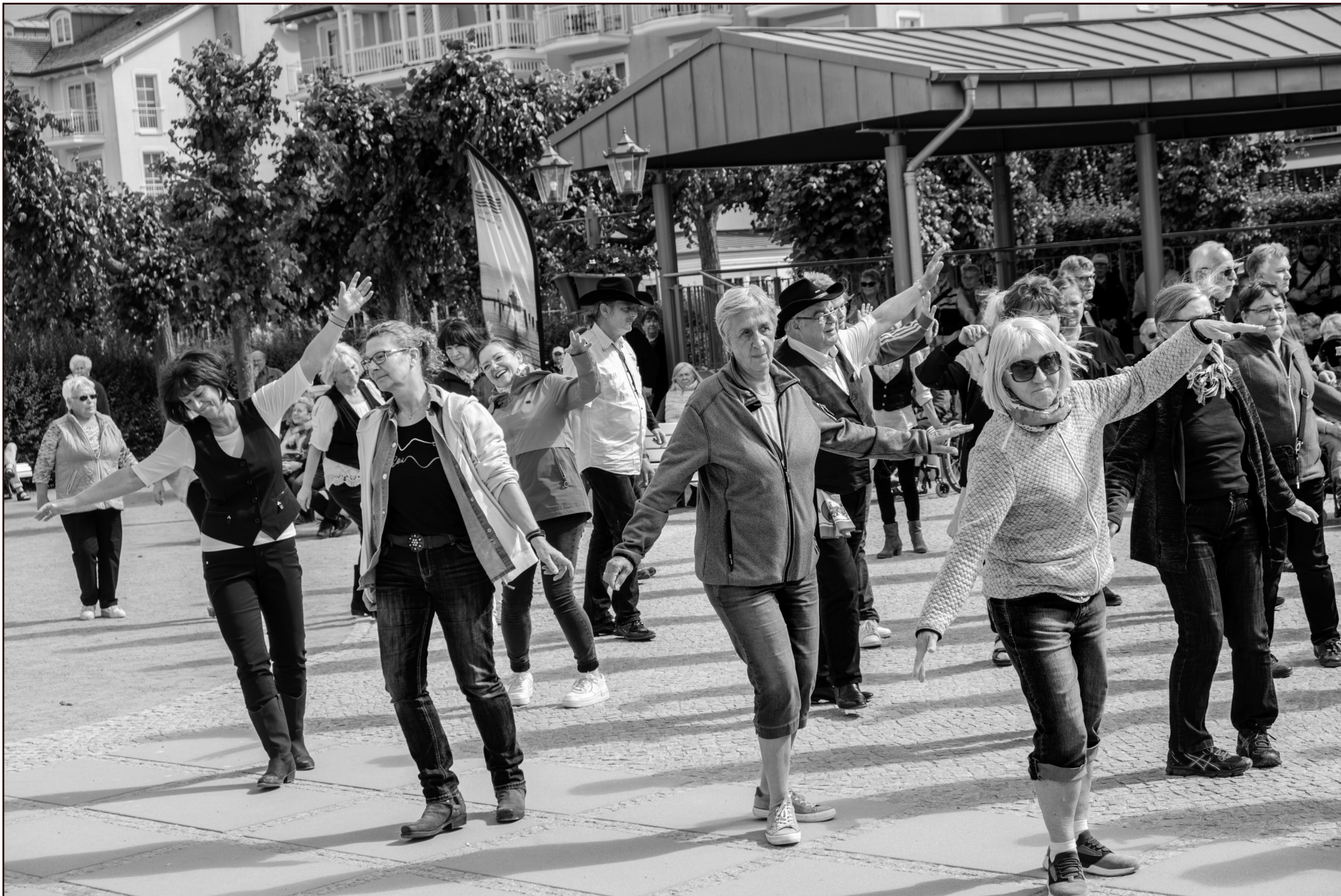
Tanzworkshop Line Dance