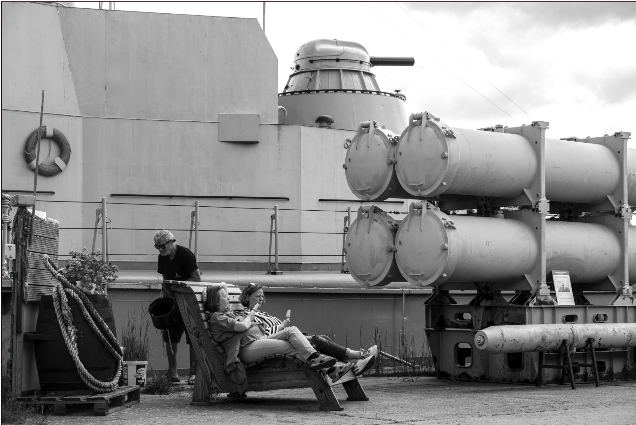
Museumsschiff (Raketenschnellboot der Volksmarine) | Peenemünde