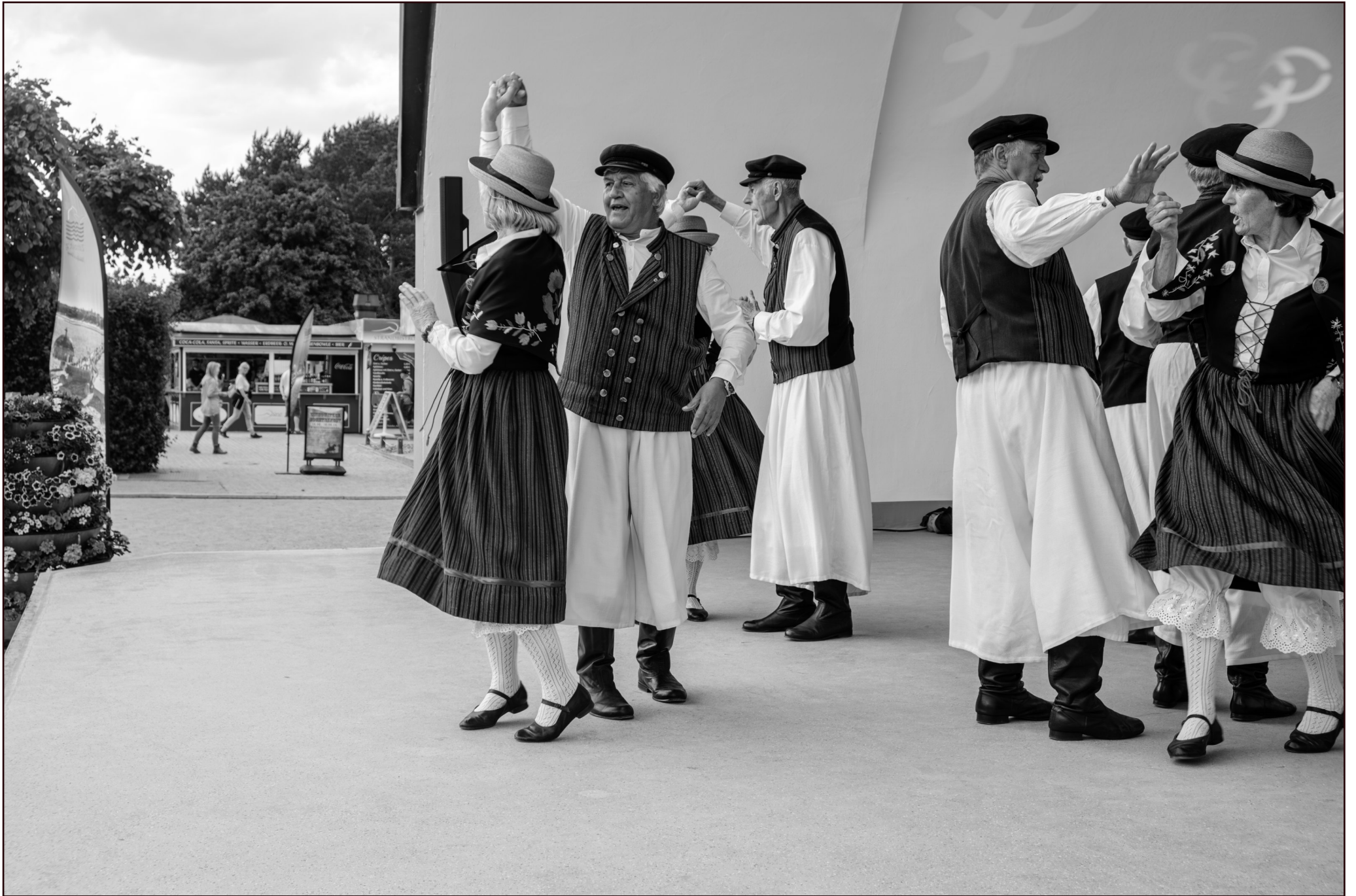
"Dei Lieper-Winkel'schen Danzlüh" | Volkstanzgruppe