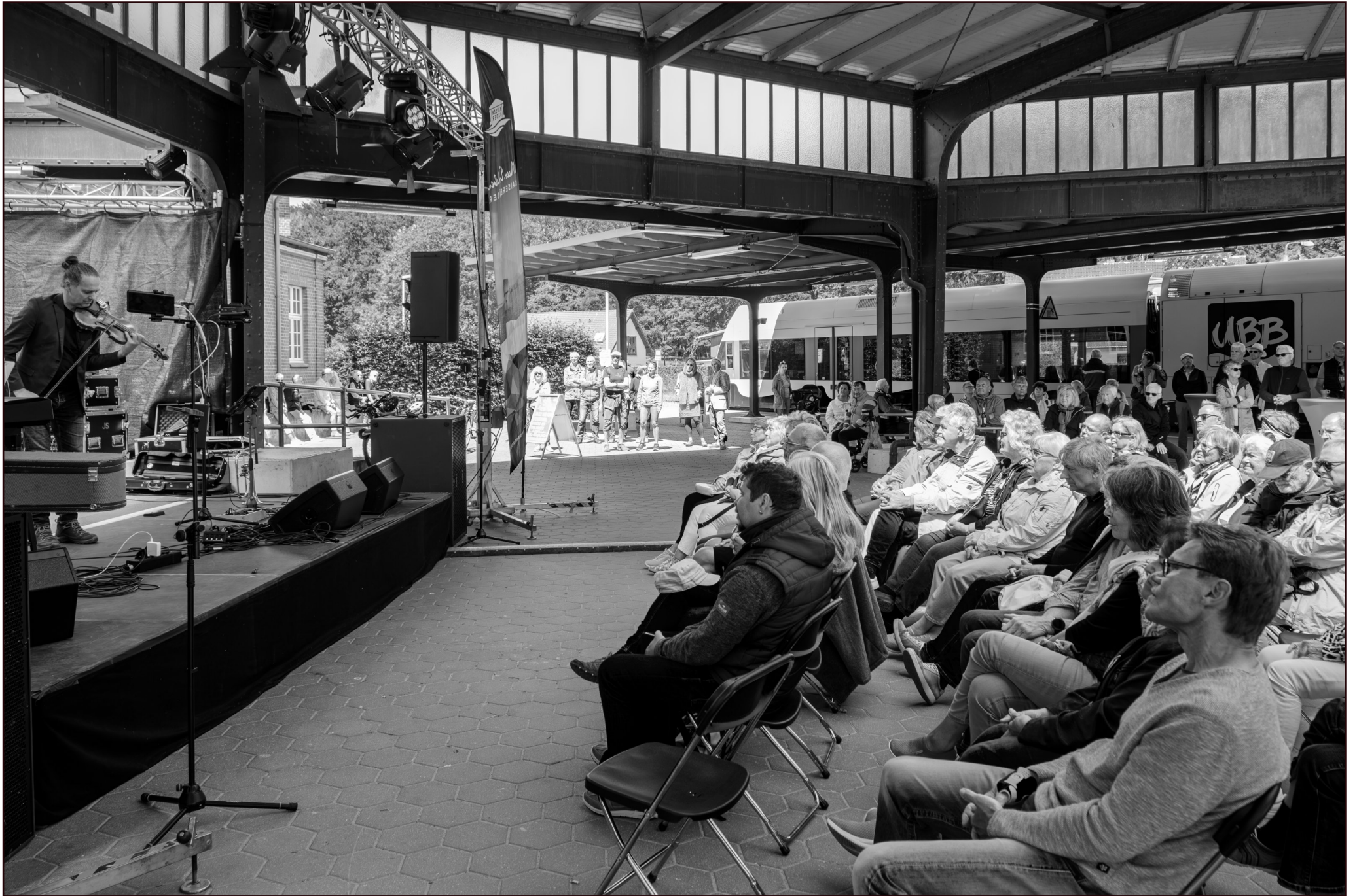
"Putensen Beat Ensemble" | Jazz im Bahnhof